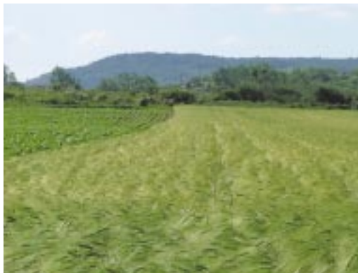
Kisparcellás táblák