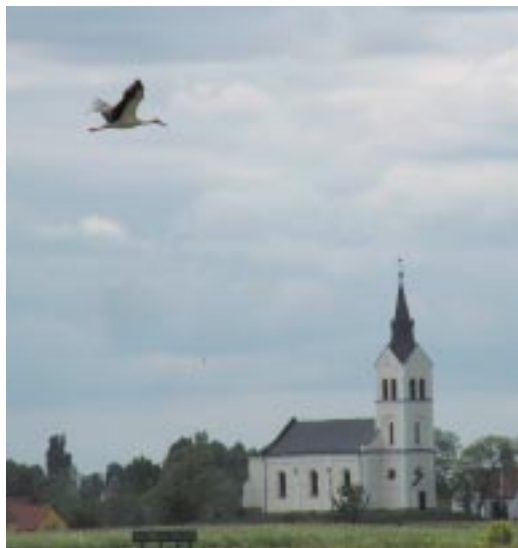
Fehér gólya falu szélén