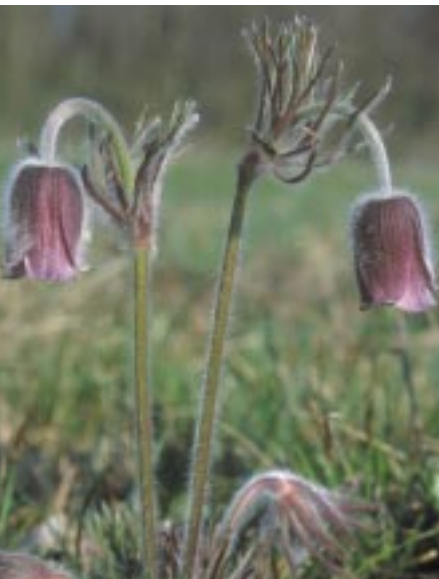
Magyar kökörcsin

a rendelet hatályba lépésével Natura 2000 területté válnak. A többi javasolt terület megőrzését szintén e naptól kezdődően kell biztosítani, de Natura 2000 területté való kihirdetésük egy szakmai egyeztető folyamat után legkésőbb 6 éven belül válik véglegessé.