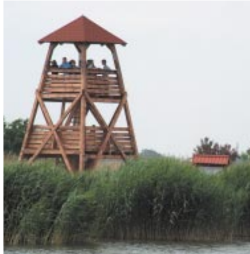
Madármegfigyelő torony

Egyre növekszik az igény az olyan jellegű termékek iránt, melyek egészségesek, minőségük kimagasló és tartósító-, illetve adalékanyagot egyáltalán nem, vagy csak kis mennyiségben tartalmaznak. E minőségi termékek előállítására a kisebb volumenű termelést, extenzív módszerek alkalmazását igényli. Külföldi és magyar példák is igazolják, hogy megfelelő védjegyek, árujelzők alkalmazásával e termékek különleges minősége és származási helye között megfelelő kapcsolat alakítható ki (pl. vasi szürkemarhacolbász).