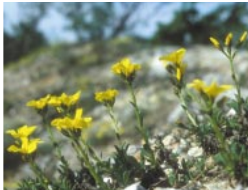
Pílisi len