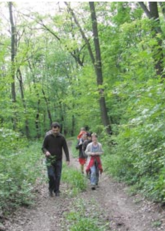
Szelíd turizmus