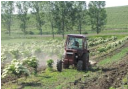
Kisüzemi termelés

Sok esetben a terület kijelöléséig végzett tevékenység folytatható, sőt gyakran ez a terület értékes fajainak, élőhelyeinek fennmaradásához szükséges, illetve annak elengedhetetlen feltétele. Bizonyos tevékenységek esetén szükséges lehet azok bizonyos mértékű korlátozása: pl. egy ritka