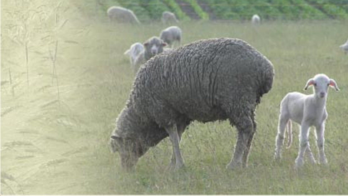
Legelő birkák

A kiadványt a Natura 2000 munkacsoport a Természetvédelmi Hivatal munkatársaival együttműködve készítette. A munkacsoportot négy országos civil szervezet hozta létre 2002-ben. A Natura 2000 munkacsoport célja, hogy a hálózat területein elősegítse a megfelelő életfeltételek biztosítását az ott élőknek, beleértve a vidék élővilágát is. A Natura 2000 munkacsoport feladatául tűzte ki, hogy fellép a Natura 2000 hálózat értékeinek megóvása érdekében, ezért társadalmi, szakmai és nemzetközi szinten folytat kommunikációt.