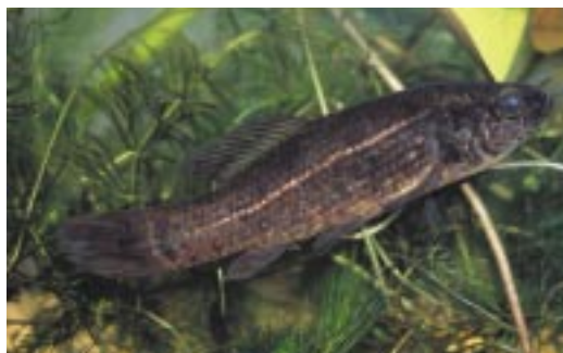
Lápi póc