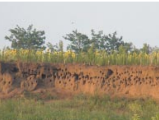
Gyurgyalagos löszfal