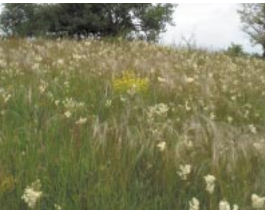
Árvalányhajás gyepek