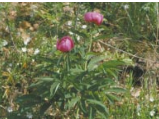
Bánáti bazsarózsa